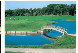
où nous vivons.