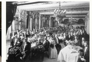
où nous papotons.