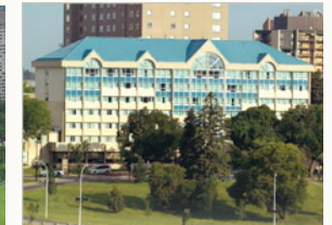
où nous nous rencontrons.